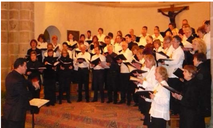
Concert du 21 mars en partenariat avec Chant des Ussets de Marlioz

Le 21 mars, Fin'Amor a accueilli le Chant des Ussets de Marlioz en Haute-Savoie, pour un concert commun en l'église du Montet. C'était la première étape d'un échange avec les alti-savoyards qui s'annonçait sous les meilleurs auspices.