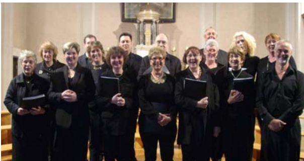
Concert du 8 mai à Chilly (Haute-Savoie)

Le week-end du 8 mai, Fin'Amor s'est rendu en Haute-Savoie pour deux concerts magiques et d'émouvants moments de convivialité avec ses homologues du Chant des Ussets, ainsi que la découverte d'Annecy et de sa région.